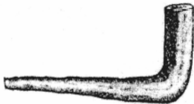
ቀርን መሰንቆ፣ በታላላቅ በዓላት የሚነፋ ፤ ሕዝብን ወደ ምክራብ፤ ወደ ቤተክርስቲያን የሚሰበሰብ