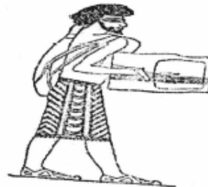
የእሱራውያን መሰንቆ፣ የአሦር ሰው መሰንቆ ሲጫወት ያላያል።