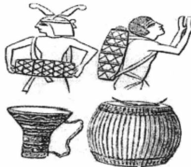
የእሱራውያን ክበሮ፣ በጠፍርና በቆዳ የተጠፈረና የተጠፈዘ