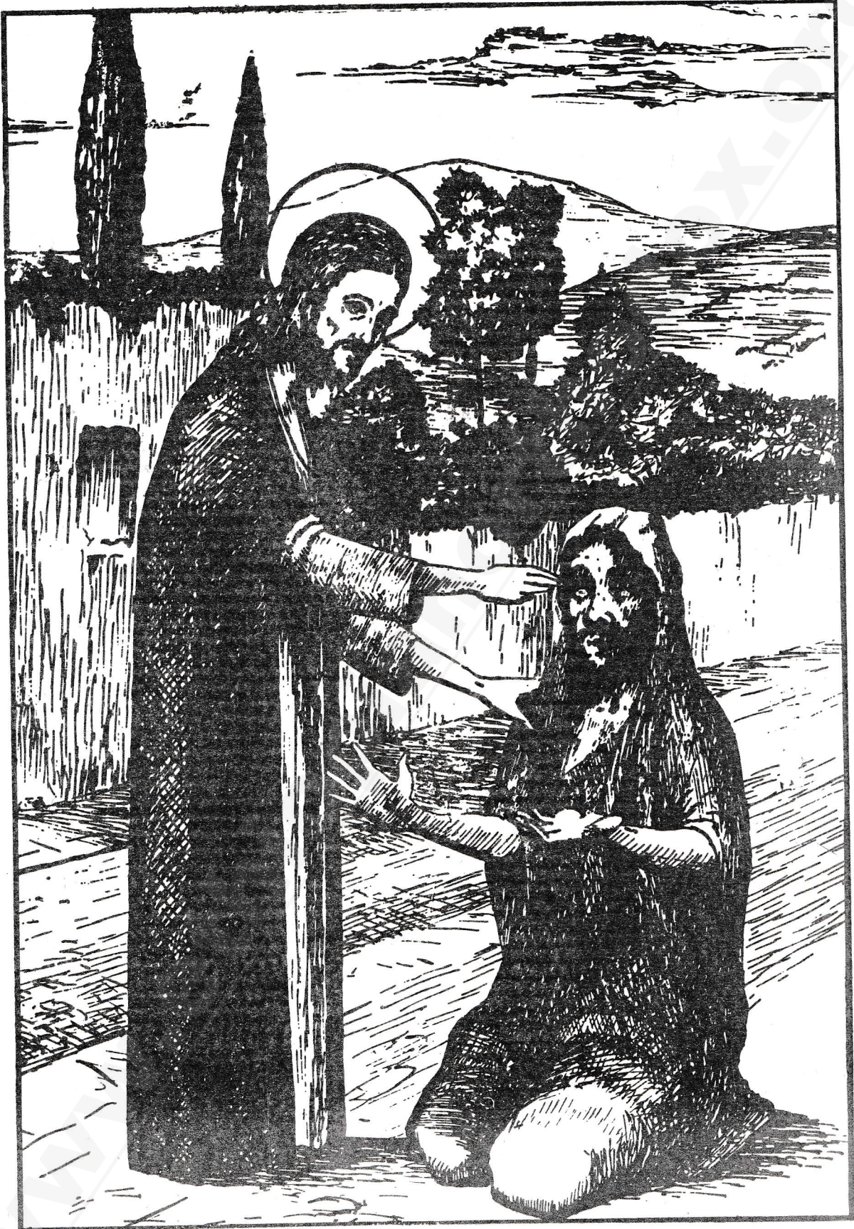
ወይሁብሙ ለዕዉራን ብርሃን ከመ ደርአዩ ።