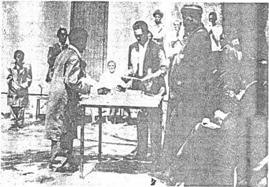
ብጹዕነታቸው ለሠልጠኞች ካህናት የምስክር ወረቀትና ሽልግት ይሰጡ በነበሩበት ጊዜ