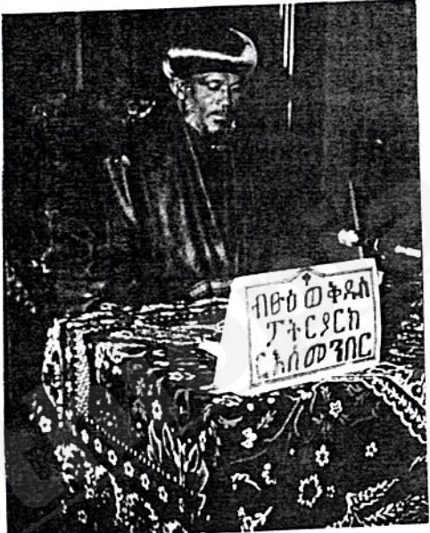
ቅዱስነታቸው ቃለ ቡራኬ ሲያስተላለፉ

ሰው ሆኖ ተወለደ = በተወለደበት ሰዓት በቤተ ልሔም አካባቢ መንገዶቻቸውን ይጠብቁ ለነበሩ እረኞች የእግዚአብሔር መልእክ