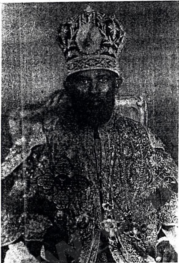
ትግስታቸው ቃለ ቡራኬ ሲያስተላልፉ

በአሁኑ ሰዓት በከተማና በገጠር ፣ በጠረፍና በመሐል አገር የምትገኙ ኢትዮጵያን እንዲሁም የሀገርን ርእሰ ሊቃነ ጳጳሳት ፣ የወገንን ደኅንነት ፣ ለመጠበቅ በየክፍሉ ያላችሁ ወገኖቻችን ፣ በሕመም ምክንያት