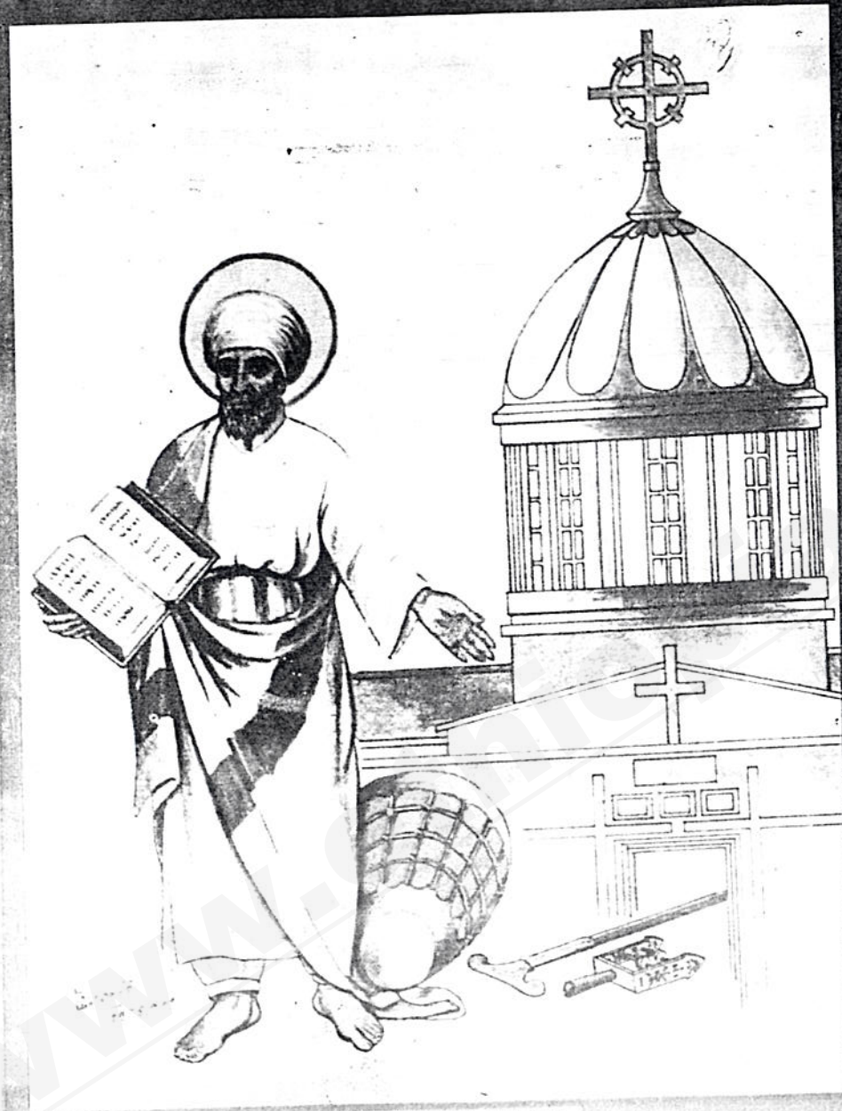
ቅዱስ ዮሐንስ ስጦታ ማስገልጫ