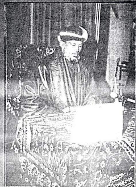
ብዙስ ወቅቱ ለገብነት መርቆሬዎስ ፓትርያርክ ርእሰ ሊቃነ አገላግታ በአ.ተ.ጽያ