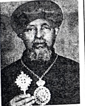
ብፁዕ አቡነ አብርሃም ሊቀ ጳጳስ

ጠልን የሕይወትና በረከት ለጋሥ ከሆነው መድኃኔ ዓለም የተትረፈ ረፈ ጸጋና በረከት ለማግኘት መልካም አጋጣሚ ስለሆነላችሁ አሁንም ደግሜ እንኳን ደስ ያላችሁ እላለሁ = እንግዲህ ለማየት ዓይንን በሚግርክ ሁኔታ ባሽበረቃችኋት በዚህች ቤተ ክርስቲያን የውጭ ሥነ ገጽታዋን ብቻ ለመመልከት ሳይሆን ወደ ውስጥ ገባ ብላችሁ በመቁረብ ሥጋና ደሙን በመቀበል ተጠቀሙበት ይህን ያደረጋችሁ ሥጋውና ደሙን የተቀበላችሁ እንደሆነ ድካማችሁና