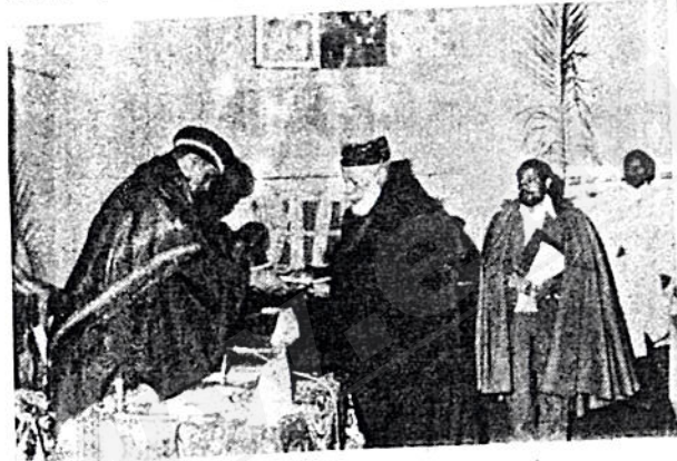
ቅዱስነታቸው በሥራ ብልሣ ላይ ሽልግት ሲሰጡ

ከህገ ጀምሮ ሁሉም ለሥራ ታጥቆ ስቲያንን ራሷን ለማስቻልና የዘቅ ተኛ ደረጃን ይዞ የሚጓዘውን የካ ጻላግም ጠንክሮ ሠርቶ ቤተ ክርስቲያን ለመሥራት ልቆ ለመገኘት