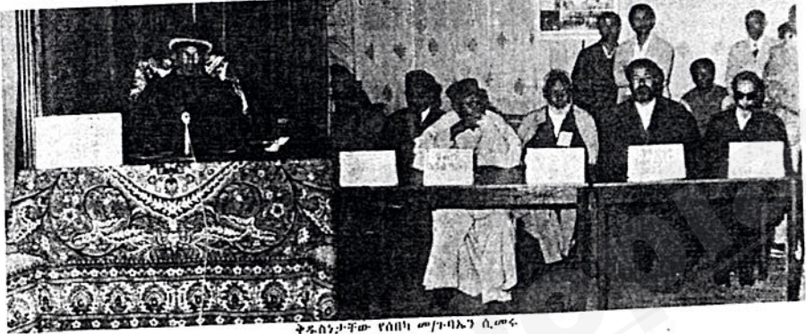
ቅዱስታቸው የሰበካ መገባወጥ ሲሆኑ

ልማት ሲባል መሬትን አርሶ ቆፍሮ ዘር ዘርቶ ማብቀል አትክልትን ተክሎ ማጽደቅ ብቻ ሳይሆን የተማሩ ሊቃውንት እንዲያስተምሩ ያልተማሩ እንዲማሩ ልብስ ቀለብ እንዲያገኙ ማድረግም።