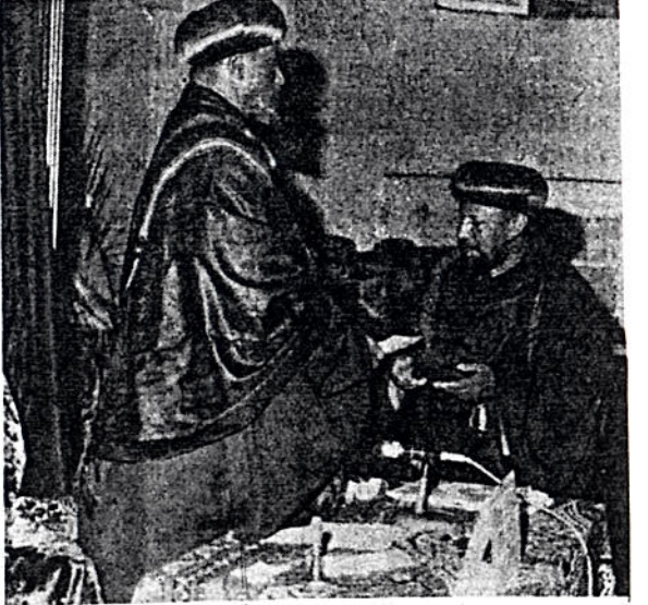
ብጥ-ዕ ወቅዱስ አቡነ መርቆሬዎስ ፓትርያርክ ርእሰ ሊቃና ጳጳሳት ከኢትዮጵያ መሥሪያ ሲሆኑ

በመንበረ ፓትርያርክ የሚደረገው አጠቃላይ (ሰበካ) መ/ጉባኤ ከተጀመረ ጅምር ዓመቱ ነው ከቀረበውም ሪፖርት ለመረዳት እንደተቻለው ከዓመት ወደ ዓመት የሚታየው ዕድገት እጅግ የሚያስደስትና የሚያስመካ ነው። ቤተ ክርስቲያናችን አሁን በየዘቸው ጉዳና ከተራመደች ራዲን ችላ ሌላውን የምትረዳበት ጊዜ ሩቅ አይሆንም ከቡር ዳዊት ለእግዚአብሔር ስፍራ ለያዕቆብም እምላክ ቦታ እስካገኝ ድረስ በእውነት ወደ ቤቱ እንኳን አልገባም። ወደ ምንጣሬም አልጋ አልወጣም። ቤተ ክህነት ሥራውን እያቆየ የመሥሪያ ኃላፊዎች ሳይቀሩ በሥራው