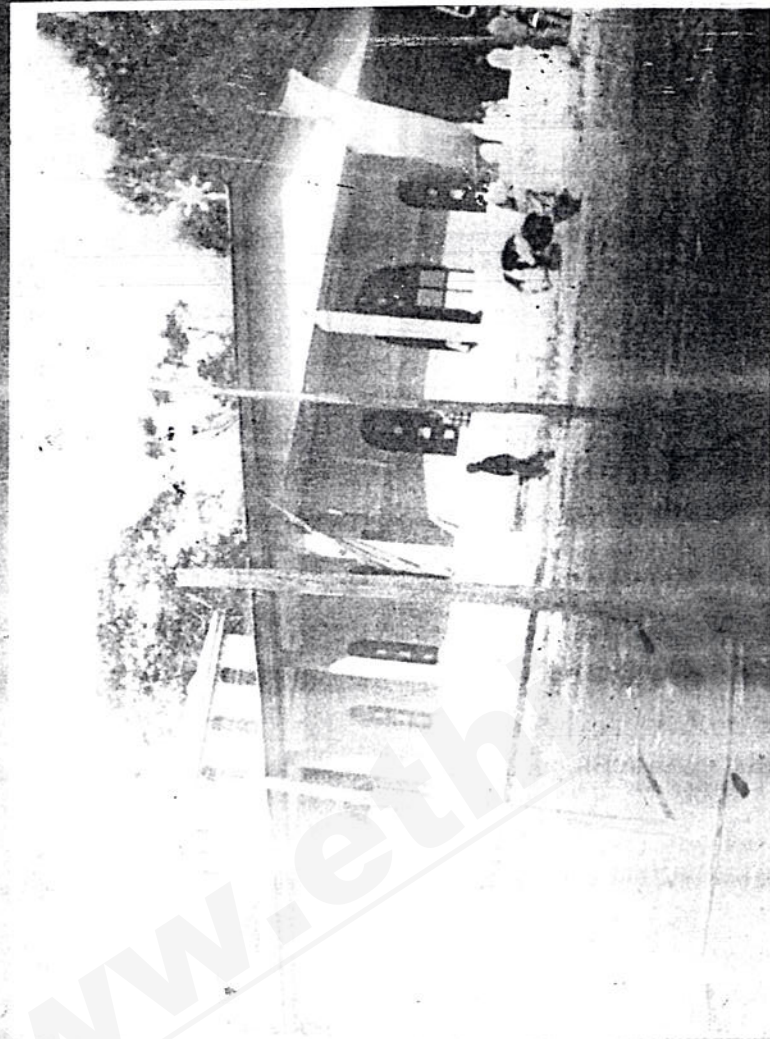
የሙሉ ድብረት ለጳጳስ ቤተ ክርስቲያን ሆንሳ ከፊት ለፊት ሲታይ ።