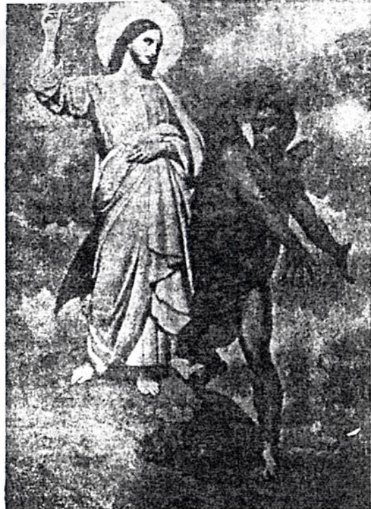
ጌታችን መድኃኒታችን ኢየሱስ ክርስቶስ ለደማን ለያደራው

በዚህ መሠረት ማለትም ከቂ ምና ከበቀል ነፃ በሆነ ሕልና የሚደረግ ጾምና ጸሎት ከእግዚአ ብሔር ፊት ይደርግል እንደተ ድዋ አባቶቻችን ጾምና ልዩ ልዩ አስደናቂ ሥራዎችንም ያደርጋል እጋንንትንም ያባርራል ኃያላቸ ውንም ይውብራል ። ዝንቱ ዘመድ አይወጽእ በእንበል ጾም ወጸ ሎት” (ይሁ ፲፮ን ያለ ጾምና ጸሎት አይወጣም ተብሎ ተጽፎአልና ። በሌላ በኩል ደግሞ ቀደም ሲል