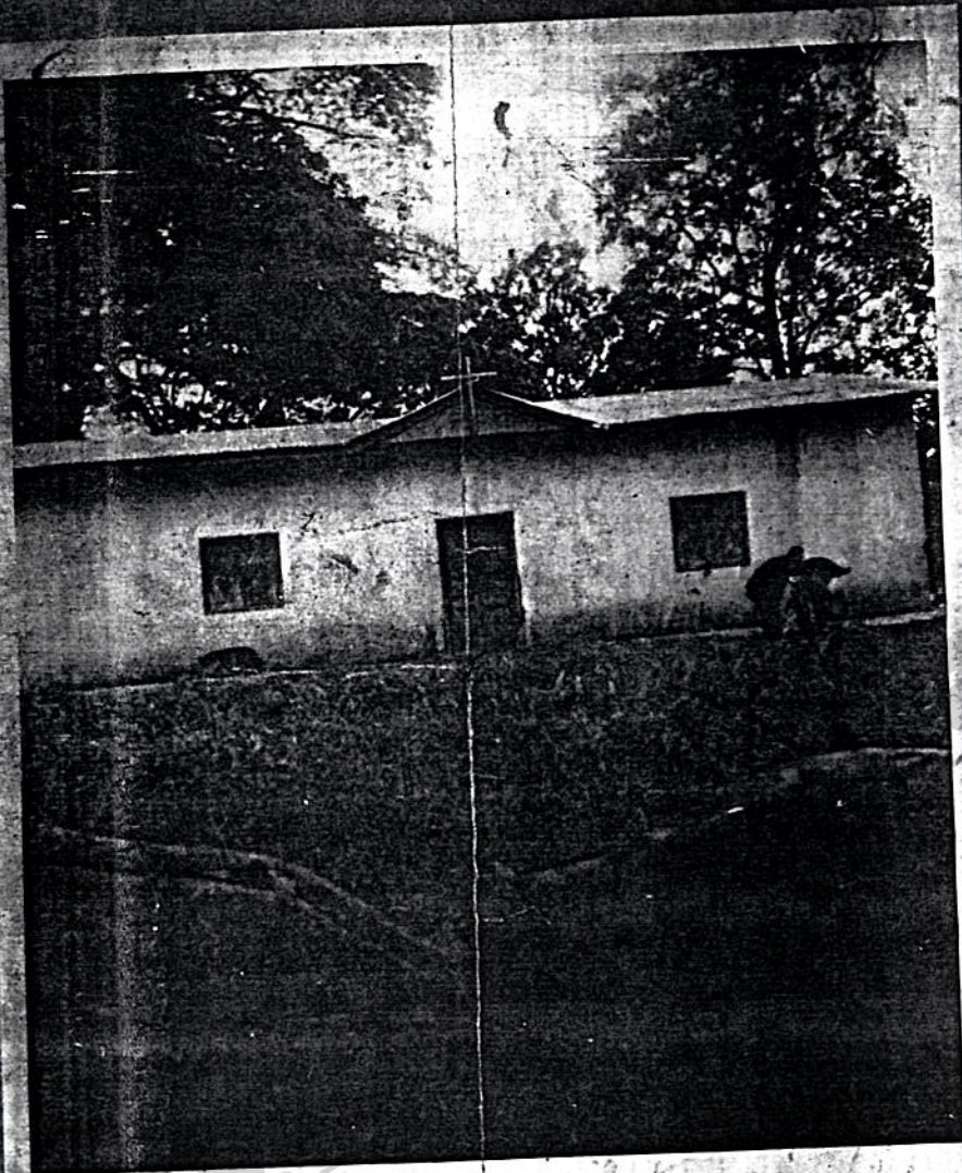
በከፋ ሀ/ ስብከት በለ.ሙ. አውራጃ መካከ ጥበብ ምድሪያ ዓለም ቤተ ክርስቲያን