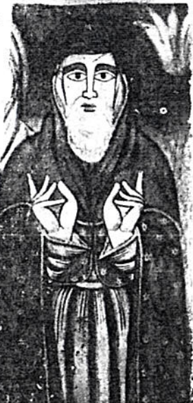
ጸድቁ አባ ሊባኖስ

ድል እንዳያደርጉ ቃል ኪዳን ከአምላክ ተቀብለዋል ብዙ ሙት አንሥተዋል በአፈለቀው ውሃ ብዙ ጌታ ምን ተፈውሰዋል ሥጋውን በጸም በጸሎት በቀድቁ በሥራ አድክሟል ከሰባት ቦታ ላይ በኢትዮጵያ አውራጃዎች የእንድነት ገዳም አቋቁሞአል ብዙ ኢላማ ንያንን አስተምሮ አጥምቋል ከሆናትን ዲያቆናትን ሸሚል በዚያም መግብ በተባለው በዓቱም ከፈጣሪው ጋር በጸሎት ተገናኝቶ ጌታችን ኢየሱስ ክርስቶስ ስለጸድቁ አባ ሊባኖስ ተገልጾ ወዳጁ ሆኖ ጸበሎች ሁሉ የተጠመቁ በሽተኞች ይፈውሱበታል ዓይን የሌላቸው ዓይናቸው ይበራል ጀሮአቸው የደንቆረ ይሰማሉ ለምዕ ያለባቸው ከለምጸቸው ይፈውሳሉ። ለጋጠላተኞች ይቅርታ ይደረግላቸዋል።