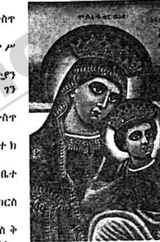
አለቃ መዝሙር ከግልገልገል ሥዕሎች አንዱ

ሀ/ በነልጋታ መድኃኔዓለም ቤተ ክርስቲያን የንግሥተ ሰባን ታሪካዊ ሥዕል ለ/ በዓልዓዛር ተክለሃይማኖት ቤ/ክ የውስጥ ሥዕል በሙሉ ሐ/ የአያሪት ሥላሴን ገዳም የውስጥ ሥዕል በሙሉ በነገ ሠርተው አስረከበዋል። አለቃ መዝሙር ዘዳዊት በ፲፱፻፶፯ ዓ.ም እና በ፲፱፻፶፱ ዓ.ም. ከባለቤታቸው ጋር አ.የሩሳሌምን የጉቦኙ ቢሆንም፣ በዚች ቅድስት ሀገር የሥዕል ሥራቸውን ባለማኖራቸው ለአ.የሩሳሌም ገዳማትና ማገባራት ዕድገት እጅግ ይጥሩ የነበሩት በጊዜው የነበሩት የአ.የሩሳሌም ሊቀ ጳጳስ ብጮ አቡነ ማቴዎስ ደጋግመው ስለጠየቁት በ፲፱፻፷፯ ዓ.ም ወደ አ.የሩሳሌም ሄደው ከፍ ብለው የተጠቀሱትን የሥዕል ሥራዎች ሠርተዋል። በዚህም ጊዜ ቀደም አድርገው የሠሯቸውን የንግሥተ ሰባን ታሪካዊ ሥዕሎችን የዓለም ተራሰት እንደገቡና፡ ውሃ ያለማቋረጥ በሚገኘው በጉልጉታ መድኃኔ ዓለም አኑረው ስለነበረ የዓለም ጉብኝዎች ይኸን ሥዕል የሠራው አፍሪካዊ ሠዓሊ የት ነው የሚገኘው? እያሉ በመጠየቅ አለቃ መዝሙር ከሚሠሩበት ሥፍራ ድረስ በመሄድ በአድናቆት ይመለከቱ ነበር። ይህም ሥራቸው አትዮጵያን ብቻ ሳይሆን ሙሉውን እና ራሱን ግምር የሚያኮራ በመሆኑ በዓለም ተራሰቶችና በሌላው ጉብኝ ዘንድ ኢትዮጵያ ሀገራችንንና ሠዓሊ መዝሙር ዘዳዊትን ዛሬም ሆነ ወደፊት ሲያስታውስ ይኖራል።