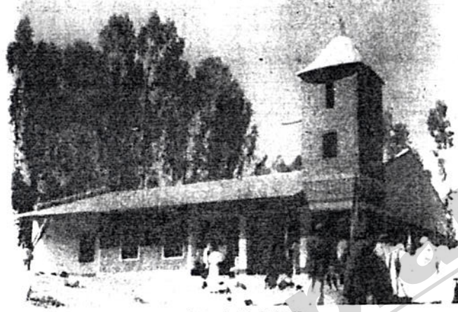
የአለን ቅዱስ ጊዮርጊስ ቤተ ክርስቲያን

በመሆኑ የካቲት ፯ ቀን ፲፱፻፸፯ ዓ.ም. ስብሰባ ተደርጎ ውይይት ከተካሄደ በኋላ አሠሪ ኮሚቴ ተመርጦ ከኮሚቴው ትጋት ጋር ምእመናንም ስለተባበሩ የቤተ ክርስቲያን ሥራ ተፈጽሞ ሁላችንም ለግዮት በቅተናል ይህንንም ሥራ ላስፈጸመን ቸር አምላካችን ክብርና ምስጋና ለናቀርብለት ይገባናል ብለዋል የኮሚቴው ሊቀ መንበር ለዚ