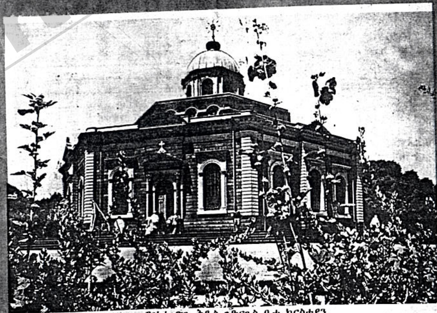
የነተ ጽጌ ቅዱስ ጊዮርጊስ ቤተ ክርስቲያን