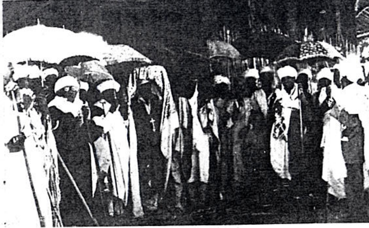
ታቦቱ ወጥቶ ዐደት ሲደረግ