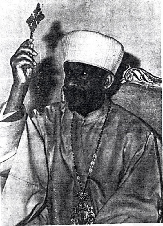
ቅዱስነታቸው በዘመን መልዕክት ቃለ ቡራኬ ሲያስተላልፉ

አእምሮ ከመ በጽሐ ጊዜሁ ለነቂህ እምንምም ሐላፊ ሌሊት ወመጽእ መጻ ልት ከንዋመ ሐኬት (የምትነቁበት ጊዜ እንደደረሰ ዕውቀት)