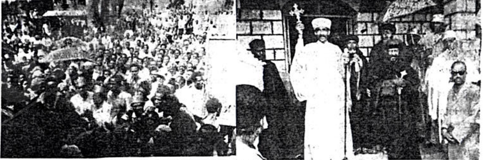
ቅዱስነታቸው ለመቀበል የተሰበሰቡትን ሕዝብ ሲባርኩ

ለሁ ብሏል በክርስቶስ ያመነ ምንጊዜም ከመከራ ሥጋና ከመከራ ነፍስ ይደና ልና ሁሉጊዜ ድምፁን እየሰማን ልናገለግለው ይገባናል የበጎች ምእመናን እምላክ ለእኛ ያደረገልንን ውለታ ካወቅንና ከተረዳን ሕያዋን ሆነን እንኖራለን የእግዚአብሔርም ጸጋ ሁሉጊዜ ከእኛ ጋር ይኖራል ክርስቶስ ሰው ሆኖ ያስተምር በት በነበረው ዘመን ስምዖን ፈረሳዊው ጋበዘው፡፡ ወደዚህ ሰው ቤት ገብቶ ሳለ እንዲት ኃጢአተኛ ሴት ሽቱ የሞላበት የአልባስጥርስ ቢልቃጥ እምጥታ እያለ ቀሰች በእንባዋ ጭምር ታርሰው ጀመ