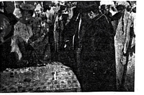
ብፁዕ ወቅዱስ አቡነ ተክለ ሃይማኖት የቤተ ክርስቲያንን የመሠረት ደንጊያ ሲያፍሩ