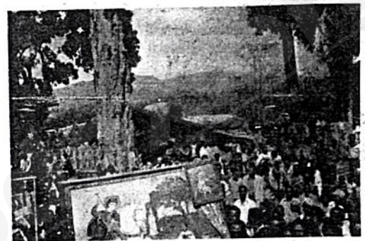
ቀዳሳቸው ያርኪ ተገኝቶ ሲደርሱ የተደረገላቸውን ለቀበል ይህን ይመስል ነበር

ቤተ ክርስቲያን ሰውና እግዚአብሔር የሚገናኙባት የክርስቲያኖች ሁሉ ቤት ናት ይህችን የጋራ ቤታችሁን ቤተ ክርስቲያን ተብሎችሁ እንድትሠሩ አደራ እንላችኋለን አሁን ከዚህ ቦታ ላልተገኙትም ክርስቲያኖች ንገሯቸው