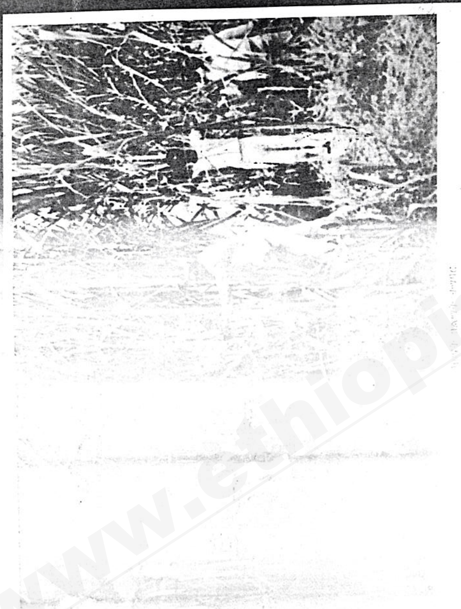
የቤተ ክርስቲያን ግድብ