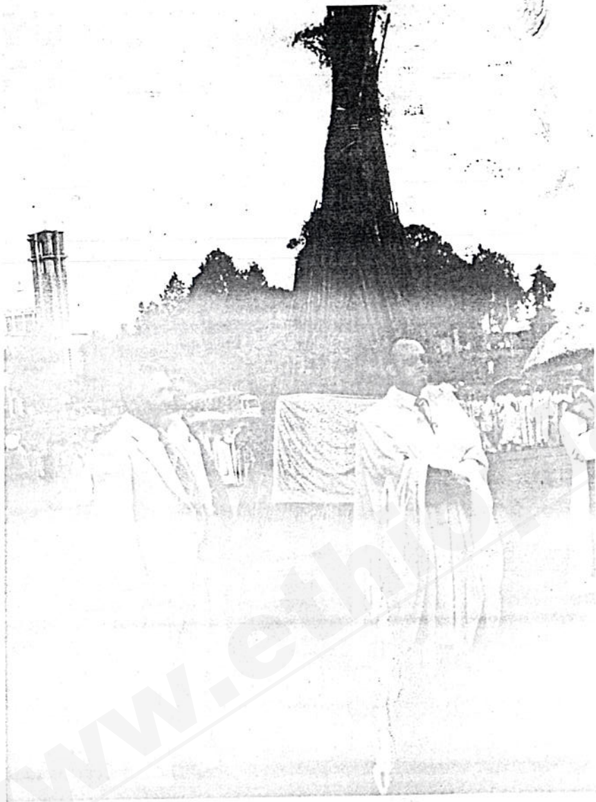
የደመራ በዓል አካባቢ