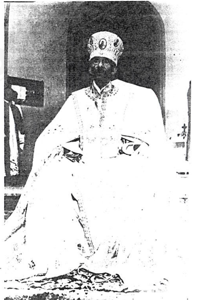
ብጹዕ ወቅዱስ አሱን ተክለ ሃይማኖት ፓትርያርክ

ርዕሰ ተክለ ሃይማኖት የሚለውን በመቀበል ለግጅ ደቂቃ ያህል አሸበሸቡ ።