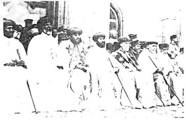
ብፁዕ ሊቃና ጳጳሳት በገዳ ላይ እንዳሉ

ጅም/ ቤተ ክርስቲያናትን የዓለም አብያተ ክርስቲያናት ማኅበር መሥራቅ አባል በመሆን ያላትም ግንኙነት እጅግ በጣም የሠመረ በመሆኑ በልማትና ክርስቲያናዊ ተራድኦ መምሪያችን በኩል ከፍተኛ የገንዘብ እርዳታ በመገኘቱ ቤተ ክርስቲያኒቱ በልማትና በድንገተኛ ደራሽ እርዳታ የምትፈጽመው ተልእኮ ከምንጊዜውም ይልቅ ጉልቶ የታየው በቅዱስነትም ዘመን