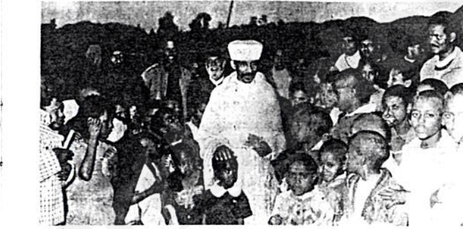
ብጹዕ ወቅዱስ አቡነ ተክለሃይማኖት እናት አባታቸው የሞቱባቸውን ሕፃናት ሲጉበኙ