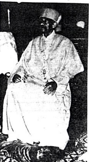
ብፁዕ ወቅዱስ አቡነ ተክለ ሃይማኖት የኢትዮጵያ ኦርቶዶክስ ተዋሕዶ ቤተ ክርስቲያን ፓትርያርክ ቃለ ምዕዳን ሲሰጡ

ምዕመናን የክርስቶስ ወገኖች መሆናቸው የሚታወቀው እርስ በርሳቸው በሚያሳዩት ፍቅርና ሰላም ነው። ሰላምና ፍቅርም የተገኘው በክርስቶስ