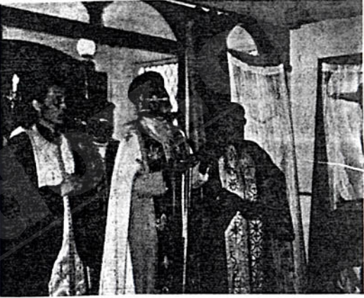
ብፁዕ አቡነ ይስሐቅ የአብያተ ክርስቲያናትን መሪዎች በአሜሪካ ሲተብሉ

ብፁዕ አቡነ ይስሐቅ በአሜሪካ የኢትዮጵያ ኦርቶዶክስ ተዋሕዶ ቤተ ክርስቲያን ሊቀ ጳጳስ የካቲት 29 ቀን 1978 ዓ/ም እንደኒውዮርክ ሰዓት አቆጣጠር ከሰዓት በኋላ በ2 ሰዓት ከፀደቁ ቃ ከቤተ ክርስቲያን አገልጋዮች ከሆኑት ጋር በመሆን በጁን ኤፍ ኬኔዲ ዓለም አቀፍ አይሮፕላን ጣቢያ በመገኘት ተቀብለዋቸዋል።