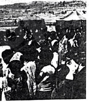
ትዳሰነታቸው የዕጻለ ማውታ ሕፃናት ሲጉበኙ