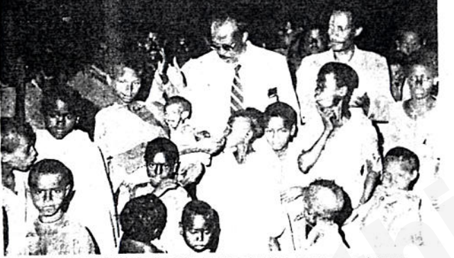
ለቀ ግለሰብ አበባው ይገባው እናት አባታቸው የጥቅምታቸውን እንዲገቡ ሲታዩ።

አፍሮፖ በእምነት የጻፈ ሰውን ፈላጊ ስት ምግብ እራሷን ያስገዛችና ፈረጊት እግዚአብሔር ከመሆኗም ሌላ በተለይ የተራበትን መመገብ ፣ የታረኩትን ግልህብ የተመጣጠነን መጠየቅ ፣ ያካትትን ግጽናት ፣ ተስፋ የቆረኩትንም ግረጋጋት የዘወትር ዓላማ ስለ ነበር ወይም ስነረጋው ሕይወት ለገደብ ማድረግ የሆነች ማን እናት አባት ያሙ እንደ ማድረግ ፈላጊ ልጆች መሆናቸውን ይህንንም ሆነ ከቤተ ክርስቲያናችን ጋር በተገባር ግላዊ ግልጽነት መጠየቅ ነን መረዳት ይገባል።