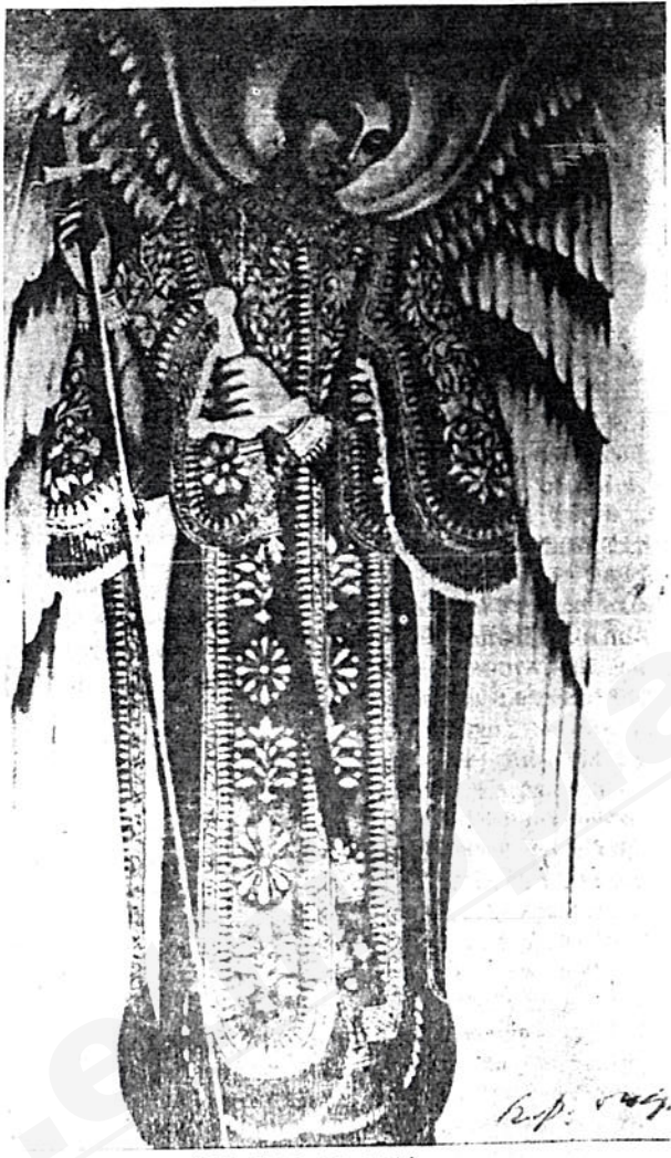
ቅዱስ ሚካኤል ሊቀ መላእክት

ቅዱስ ሚካኤል ለሰው ልጆች ከእግዚአብሔር ዘንድ ይቅርታን ሲለምንና ሲያማልድ የሚኖር መላእክ በመሆኑ የምህረት መልእክ ተባሏል ። ስለዚህም ብዙ ክርስቲያኖች በቅዱስ ሚካኤል ስም ማገር በማቋቋም በአንድነትና በወንድማማችነት ፍቅር ፣ በመተሳሰር እርስ በእርስ ከመረዳዳት አልፈው ፣ የተራራውን በማብላት ፣ የተጠ