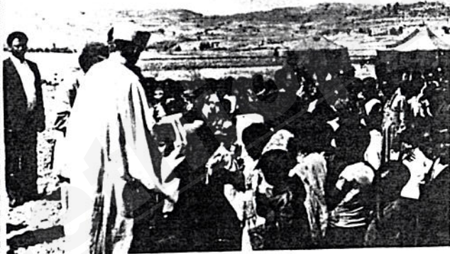
ትዳሰነታቸው የዕጻለ ማውታ ሕፃናት ሲጉበኙ

ሕፃናት በሰላም ጊዜ በሚደርስባቸው ሕመም እናቶቻቸውና አባቶቻቸው ይሞቱባቸውና ያላሳዳጊ ይቀራሉ ። “መውለድ ቀላል ነው ፣ ቁም ነገሩ ከማሳደግ ላይ ነው” ተብሏል ። ይህ እውነተኛና ተጨባጭ አባባል መሆኑን ሁሉም ያውቀዋል ። በጦርነት ጊዜ አባቶቻቸው በጦር ሚዳ ወድቀው ሲቀሩባቸው እናቶቻቸውም ከደረሰባቸው ብስጭትና ጉስቁልና የተነሳ ሲሞቱባቸው ሕፃናቱ ያለ አሳዳጊ በመቅረት ለታላቅ ፈተናና ችግር ይጋለጣሉ ።