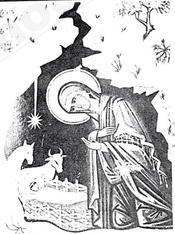
ጌታችን መድኃኒታችን ኢየሱስ ክርስቶስ በላምች በረት በተወለደ ጊዜ አህያና ላም በትንፋሻቸው ሲያምቁት ።