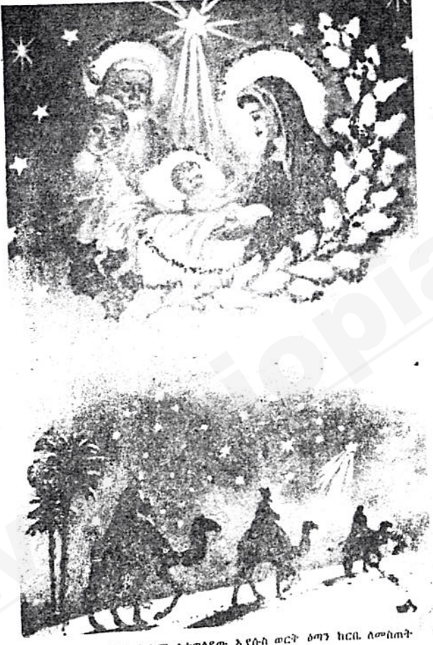
ሰብአ ሰገላ በቤተ ልሔም ለተወለደው ኢየሱስ ወርቅ ዕጣን ከርቤ ለመስጠት በግመሎቻቸው ላይ ይጻፋሉ ። ይህ ሁሉ የሚያስረዳው በመንጋ ከክህደትና ከነፋሳቱ የመጠበቅ ኃላፊ የተመሰሉ ምዕመናን በጠባቂዎች ተመነት አለባቸው ማለት ነው።

ሰለው የተነገሩት ደግሞ አስተማሪዎች መሆናቸውን ነው እንደዚህ ከሆነ አስተማሪዎች ምእመናንን የማስተማርና