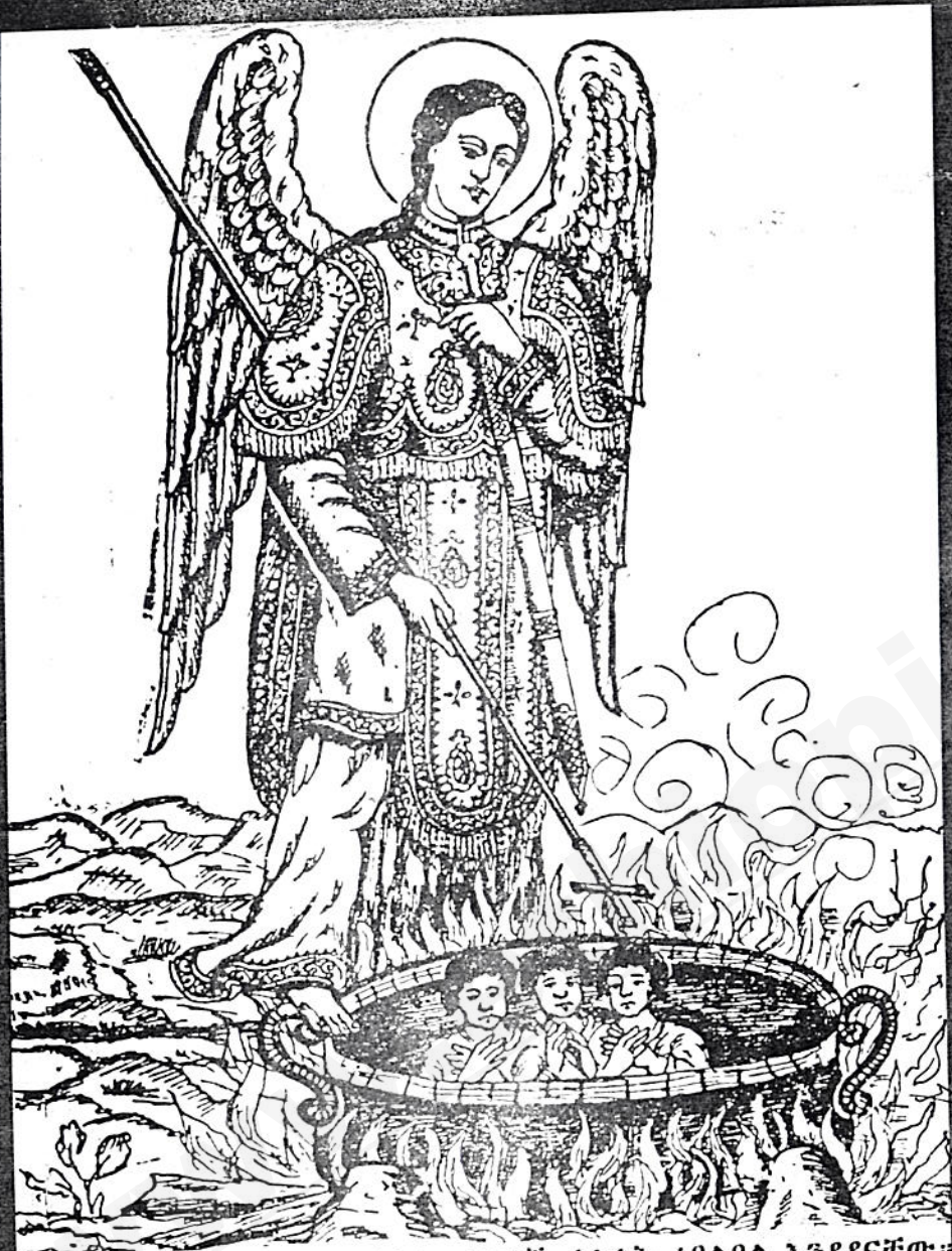
መልአኩ ቅዱስ ገብርኤል ሦስቱን ወጣቶች ከእሳት ነበልባል እንዳዳናቸው።