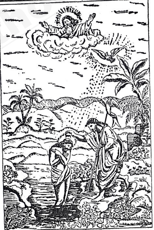
«የምወደው ልጅ ይህ ነው እርሱን ስሙት»

— ን ያህብግ · ጠካሃ · ጠቃሚ ጽሑፍ — — የሐረግ ግላሰቢያ · ህግጋት · መግቢያዎች