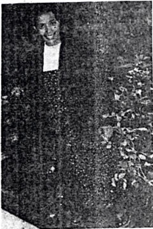
ሴት እንደሚወልዱ ተነግሮአቸው ሴት የወለዱት ወር

እርግጥ ሐኪሞች በምርመራ እንደሚቻል ይናገራሉ እንጂ በዓይን አይቶ እንደሚታወቅ አይናገሩም። ጥበቡ መንግሥቱ ግን ከብዙ ጊዜ ልምምድና አቀማመጡንም በማጥናትና በማየት ብቻ ያረገዙ ሴቶች ወንድ ይሁን ሴት የትኛውን ይታ እንደሚወልዱ ለይቶ አውቃለሁ ይላል። ይህም ከዚህ ቀደም በሬድዮና በቴሌቪዥን ቀርቦ እንደነበር የሚታወስ ነው። ነገር ግን ጥበቡ መንግሥቱ የሚለው ነገር በቤተ ክርስቲያን አነጋገር መንገድ ላይ ስለታደሰ? ወይንስ ጥንቆላ? የትኛው ብለን እኛም ሆን ሌሎች ስለተጠራጠርንና ጠይቀንም መረዳት ስለፈለግን ጥበቡን በሰፊው አነጋገረን የሰ