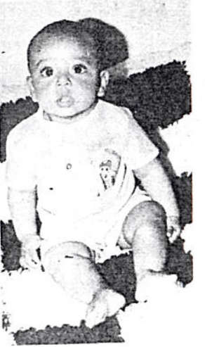
በእናቱ ግህጃል ላይ ወንድ ሆኖ እንደሚወልዱ የተነገረለት ሕገን ያነበቡ እድ ግላ

ርስ ድረስ ምርምሩ በዚህ አይነት ይቀጥላል። ውጤቱ በእጥግ ሁኔታ ከታየ በኋላ ግን ማንም ሰው ለሚረዳው ሊያውቀው እንዲችል በትምህርት እንደሚሰጥ ተስፋ አደርጋለሁ።