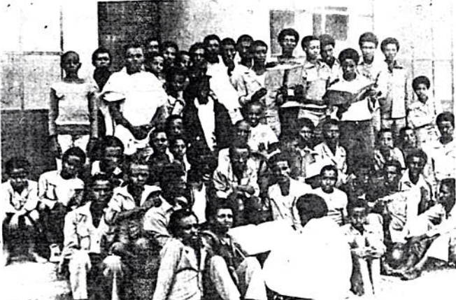
ተግባራዊ ደገብ ሲገኝ