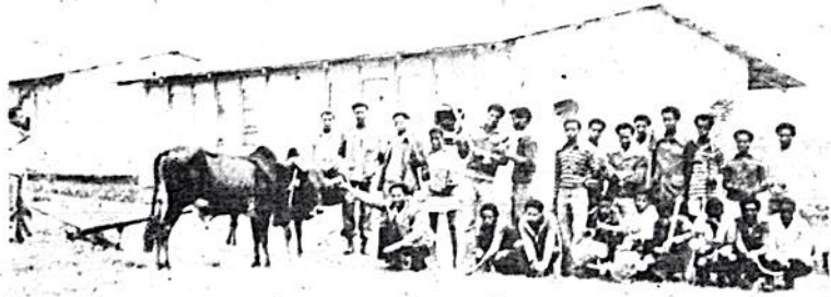
በጎም የሌለ ሰርዛ ትቤት ተግርቶ ሲያርብ

ለ ለሕፃናት ማሳደጋያ አመች ቦታ ላይ በቂ ቤት መኖሩን ስናረጋግጥ ሐ ለልጆቹ ትምህርትና ጤንነት ምቹና ተስማሚ ቦታ ሆኖ ስናገኝ እንደተረቀቀ ለሕፃናት ልጆችን ማሳደግ ጥበብ እየተገኘበት በዘመናዊ ዕውቀትም እየታነጸ ካለጁትና ዕውቀትም አብርክቻቸው ካለደገ የግርና የወገን ፍቅር እያደርገዋቸውም የነፃነትንም ክብር እያውቁም የሃይማኖትም ጽናት አይ