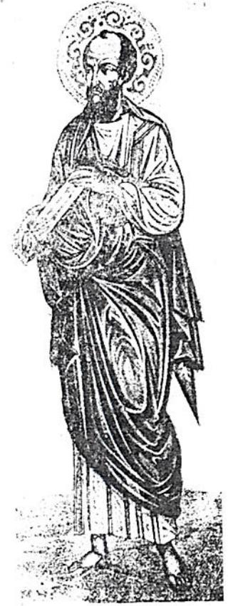
ብርሃናተ ዓለም ጳጳሮስ ወጳውሎስ