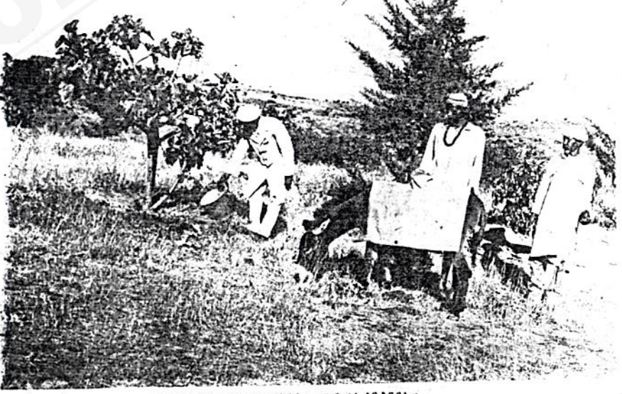
ባሕታዊ መፍቀሬ ሰብእ ከገንዘብ መግለጫ ጋር በሥራ ላይ እንዳሉ ።

ት ማደሪያ እንዲሆን በጊዜው ይጠቀሙበት ከነበሩት ግለሰቦች የማስፈቀዱ ጉዳይ ነበር ። ሆኖም ባሕታዊው ገደማ ቱን በማስተባበር ገደማቱ ገንዘብ አዋጥተው በብር 3300 ሦስት ሺ ሦስት