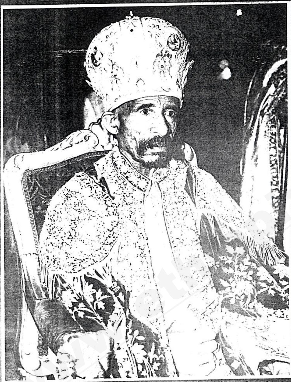
የአዲስ አበባና የመላዋ የኢትዮጵያ ኦርቶዶክስ ተዋሕዶ ቤተ ክርስቲያን ፓትርያርክ። ብዙ ወቅት ለቤተ ክርስቲያን ተከላካይ ሆኖት። የቅዱስ ሲኖዶስ ሊቀ መንበሪ

ገደብ - 5/9/71 ከላይ - ገደብ - ገደብ - ገደብ መጠን - ለቀረብ - ለቀረብ - ለቀረብ 5/9/1971