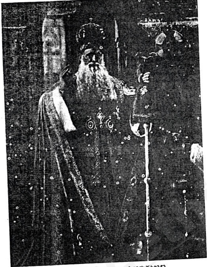
ባለሚስት የነበሩት የግንባታ ጉዳዮችን ጸንቶታዎች

ግን ባለፈው የግንባታ ስትህንኖች እንደ ገናዎ ሌላ ግንባታ ጉዳዮችን ይላል በዚህ አንጻር ሚስቱ የግንባታ ጉዳዮች ውስጥ ነው። ለምሳሌ የግንባታ ጉዳዮች በተከሰቱት ጉዳዮች ውስጥ ነው።