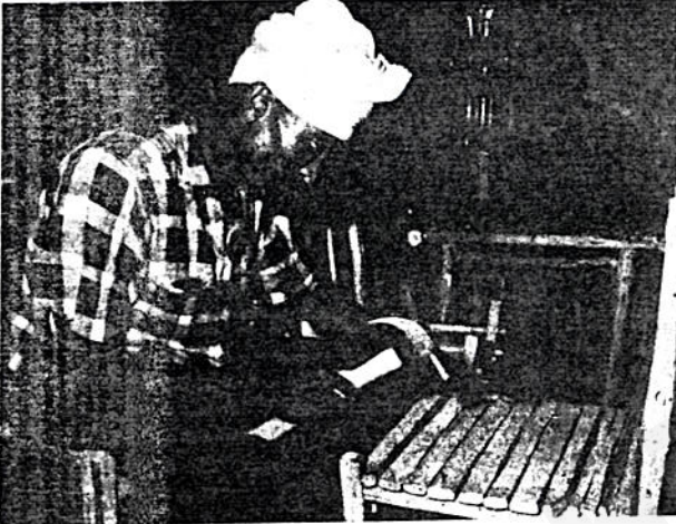
ከህገ ወገር ሲሠሩ

በምእመናንና በተመልካቾች ዘንድ ግምት ተሰጥቶታል። በሌላ በኩል ታዛቢዎች እንደሚሉት ከምእመናን ሴቶች መካከል አንዲት ሴት እንኳ ለመምረጥ በሴቶች በኩል ስለአልተወከለች “ክርስቲያን ሴቶች የቤተ ክርስቲያን መሪዎችን ለመምረጥ መብት የላቸውምን” የሚል ጥያቄ ከአንዳንድ ግለሰቦች ተሰምቷል ወደፊት ግን ማስተዋልን በተሞላ ጥንቃቄ እንደሚታወቅበት ሳናስገነዝብ አናልፍም። የ13ቱ ኤጲስቆጶሳት ሥርዓተ ሣይሙን የተፈጸመው ጥር 13 ቀን 1971 ዓ.ም. በመንበረ ጳጳሮች ቅድስት ሥላሴ ካቱ ድራል በብጹዕ ወቅዱስ አቡነ ተክለ ሃይማኖት የኢትዮጵያ ኦርቶዶክስ ተዋሕዶ ቤተ ክርስቲያን ፓትርያርክ አንገረ ሮተ እድ ነበር። በሥርዓተ ሣይሙ ጊዜ የአዲስ አበባ ከተማ ከንቲባ ጓድ ዶክተር ዓለሙ አበበ፤ በብዙ ሺህ የሚቆጠሩ ምእመናንና ምእመናን ገብ