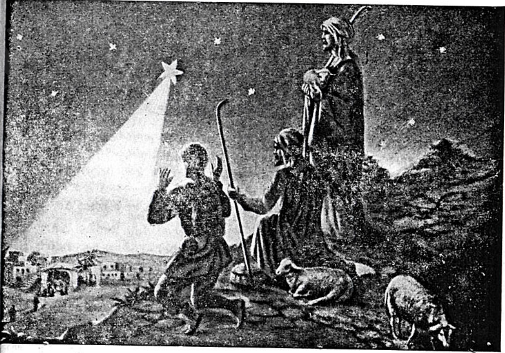
ሰብአ ሰገል በከከብ መሪነት መጥተው እንደገበሩለት።

በዚያን ሰዓት መጻሕፍተ ብሉያትን እንተረጉማለን ኃላፊያትንና መጻሕፍትን እና ውቃለን የሚሉ ምሁራን በኢየሩሳሌም ተኝተው ነበር። የጌታ ልደት በገሀድ ቀርቶ በሕልም እንኳን አልተገለጸላቸውም ሌላ ሕልምና ቅገሮች ነበር ሲያዩት ያደሩት፤ በጌታ ልደት ለብዙ ዘመናት ተለያይተው የነበሩት ማኅበረ መላእክትና ደቂቀ ኦጵም በአንድነት ሆነው ስብሐት ለእግዚአብሔር በሰማያት ወሰላም በምድር፣ ለእግዚአብሔር በሰማይ ምስጋና ይሁን በምድርም ሰላም በማለት ዘመሩ በጠፈር የነበረው የአ ጥቢያ ከከብ ወደ መሬት ገቅ በማለት ወደ ክርስቶስ የሚያመሩትን የሰባንና የዓ ረብን ነገሥታት መርቶ በቤተ ልሔም ዋሻ ክርስቶስና እናቱ ወደ ነበሩበት አደረ ሳቸው፤ ማቴዎስ ም፤ ፪ ቀ፤ ፩ እስከ መጨረሻው ተመልከት።