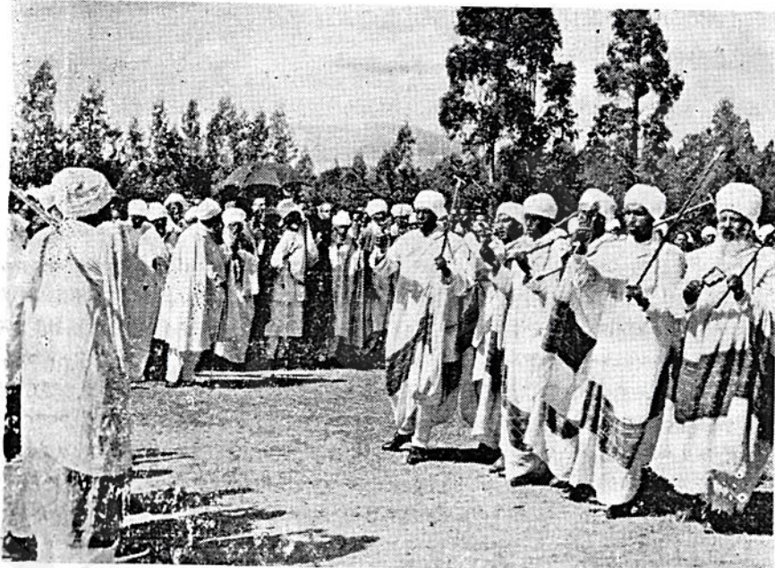
የጥምቀት በዓል አከባበር ባህልና ሥርዓት ።

በባሕሩ ላይ ስብሐተ እግዚአብሔርና ጸሎት ከደረሰበት በኋላ ቁሱ የሚባርከው የዮርዳኖስ በክርስቶስ ጥምቀት መባረኩንና መቀደሱን ለማስታወስ ነው ። ክርስቶስም