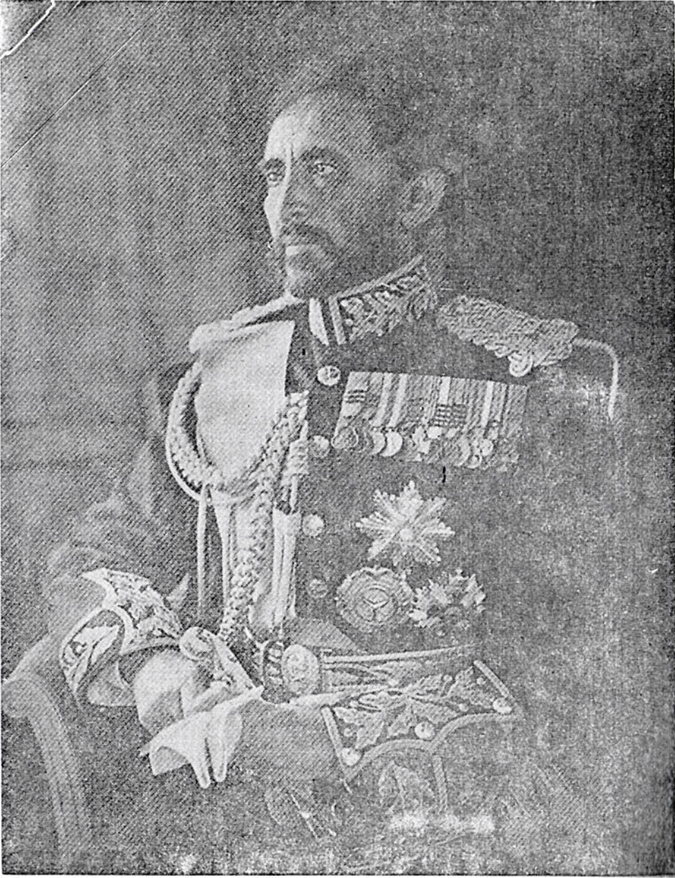
ገርግዮ ቀዳማዊ ኃይለ ሥላሴ ንጉሠ ነገሥት ዘኢትዮጵያ