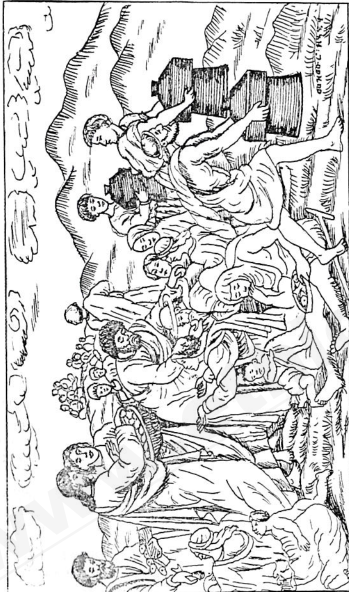
በሁለት ግማና በ፩ እንጀራ ጅጅ ሕዝብ እንዳጠገበ ።

በዓምደ ደመና (በደመና ምስሶ) የተነጋገረው ሙሴም አይቸው ነበር ፤ ልጠይቀው ግን አልቻልሁም አለ ። በሆዲ የተሸከመችው ማርያምም አይቸው ነበር ፤ ግን ልጠይቀው አልቻልሁም አለች ። በዮርዳኖስ ያጠመቀው ዮሐንስም አየሁት ፤ ልመረምረው ግን ፤ አልቻልሁም አለ ።