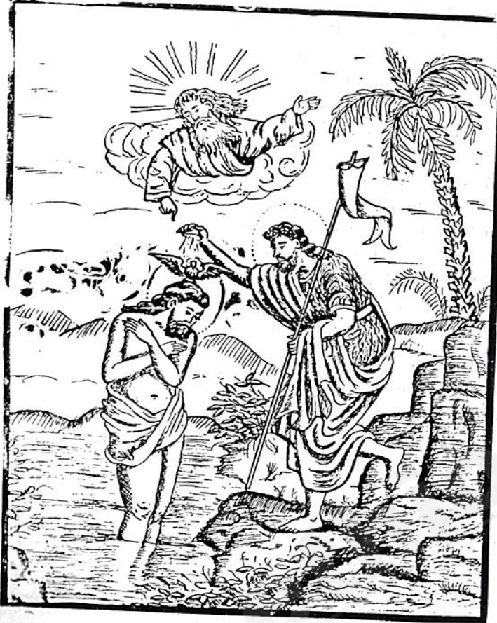
ጌታ ኢየሱስ በዮርዳኖስ እጅ እንደተጠመቀና መንፈስ ቅዱስ በርግብ አምላል እንዳረፈበት

ሰማያዊ ኢየሱስ ክርስቶስ መራታዊ በሆነው በዮርዳኖስ እጅ የተጠመቀው እኛን ከሞት ወደ ሕይወት ከጨለማ ወደ ብርሃን ከሐሳር ወደ ክብር ሊመልከንና በጥምቀት በርነት ወደ ወንጌል ብርሃን ለመግባት እንድንችል ነው ። የዓለሙ ብርሃን ክርስቶስ