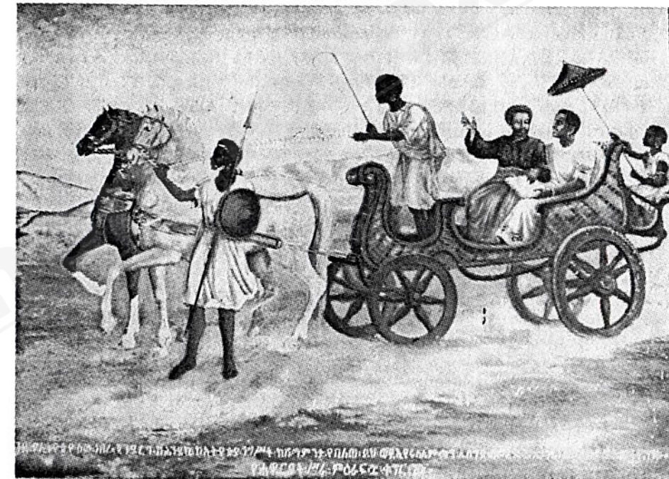
ኢትዮጵያዊው መስፍን በወረገላ ሲሄድ ፊልጶስ ትንቢቱን እንደተረጉመለትና እንዳጠመቀው

ማጥመቅ የሚገባው በፈሳሽ ውኃ ነው። ይህም ጌታችን ኢየሱስ ክርስቶስ የተጠመቀው በታላቁ ፈሳሽ ጅረት በዮርዳኖስ ስለ ሆነ ነው ማቲ ፫ ፩፫። ፊልጶስም ኢትዮጵያዊውን መስፍን ያጠመቀው በፈሳሽ ውኃ ነው የሐ ፲ ፳፯ ፴፰ በዚህ