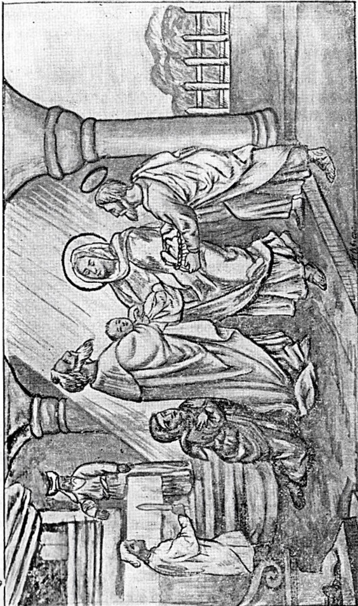
ክርስቶስ በጎቶ ወደ ቤተ መቅደስ እንደገባና እረጋግጦው ስምምን እንደታቀረው

ይህ ሕፃን ከአሥራኤል ወገን ላመኑበት ሕዝብ መድኅን ፣ ላላመኑበት ግን አጥፊ አ