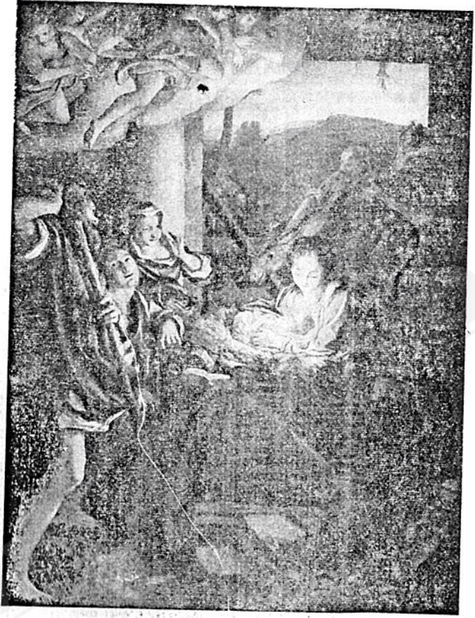
ጌታችን ኢየሱስ ክርስቶስ በቤተ ልሔም እንደተወለደ።

ከዚህ ላይ አንድ ጥያቄ አለ፣ ጥያቄውም ከዓለም ታላላቅ ሰዎች ውስጥ የዓለም በዛ የተባለ አለን? የሚል ሲሆን መልሱ በፍጹም የለም ነው። ከላይ እንደገለጽ ነው ከሞላ ጎደል ዜጋው ለሆነባት አገር ብቻ ካልሆነ በስተቀር የዓለም በዛ የሆነ አልነበረም፤ አይኖርም መድኃኔታችን ኢየሱስ ግን በጽጌጌጅ ዓመተ ዓለም ታኅሣሥ ፳፱ ቀን ሌሊት በቤተ ልሔም ዋሻ በነበረው የከብቶችና ያህዮች በረት ውስጥ ከእ መቤታችን ተወለደ።