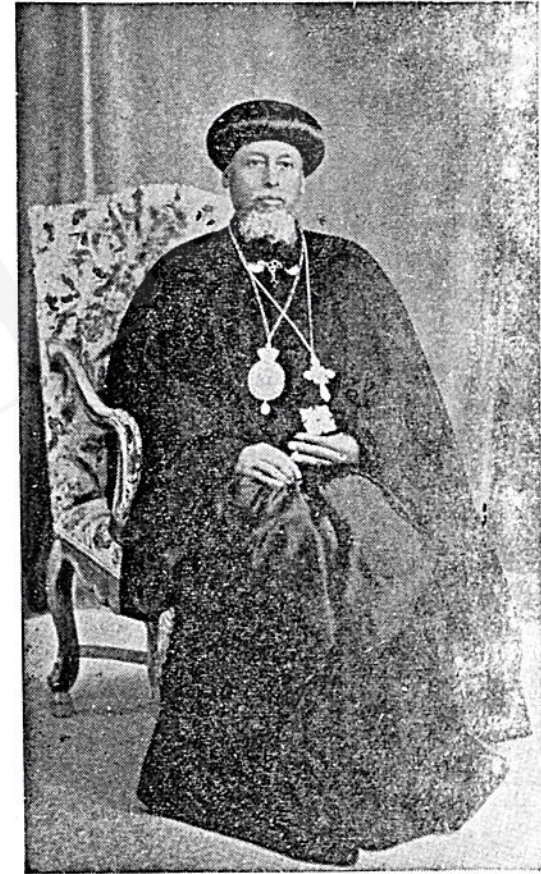
ብዑስ ወቅቱስ ኣቡነ ባበልዮስ የኢትዮጵያ ፓትረያርክ