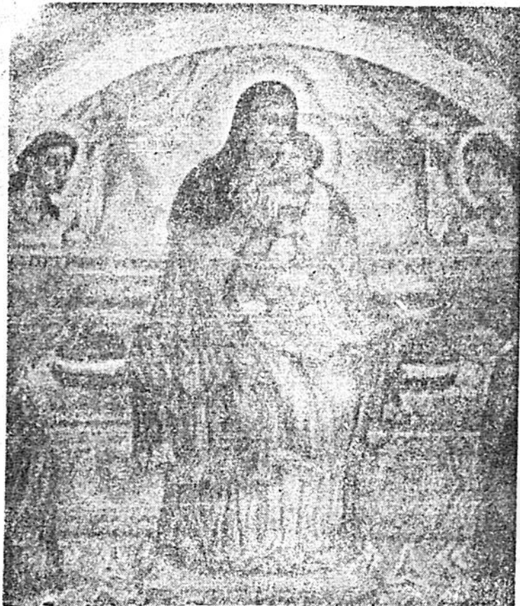
ቅድስት ደንግል ግርያም ምስላ ፍቁር ወልዳ