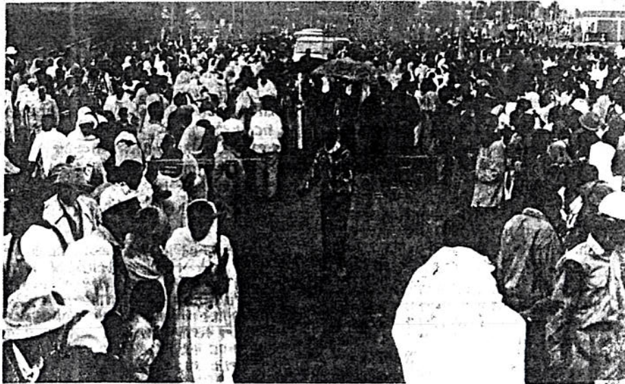
ለትዳሰ ፓትርያርክ ከህፃናት ምእመናን ለተባበሩ ሲያደርጉላቸው

ቸውንና የወንጌል ትምህርትታቸውን እግዚአብሔርን በማመስገን ጀምረው የባሌ ጎባ ምእመናን ይህን የምስል ቤተ ክርስቲያን ሠርቶ ቅዱሳን ቤተ ልማክበር በመብቃቱ የተሰማቸውን ደስታ በማድኃኑና በማመስገን ገልጸዋል አያይዘውም ለዚህ ቤተ ክርስቲያን ሕንፃ ሥራ በዚያን ጊዜ በሕይወት ሥጋ የነበሩ አሁን በሞት ጥላ ያረፉ ወገኖች የገንዘብ ፣ የሀሳብና የጉልበት አስተዋጽኦ ያደረጉ እንደነበሩ ግልጽ ነው ነገር ግን እንደ እናንተ ፍላጊውን ለማየት ባይችሉ እንኳ በእጅ ህይወት የትሩፋታቸውን ሞገስ እንደማያጡ አንጠራጠርም ብለዋል ።