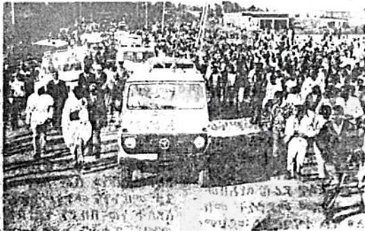
የከተማው ሕዝብ ክርስቲያን ለተባበሩ ሲያደርጉላቸው

ቀደም ሲል በዚህ ሥፍራ የነበረው ቤተ ክርስቲያን በግርግር ለማሠራት ኮሚቴ ሲቋቋም ሊቃደ እግዚአብሔር ሳይሆን ቀርቶ ሊዘገይ መቻሉንና በ፲፱፻፸፱ ዓ/ም የመታደሱ ገራ ክፍል