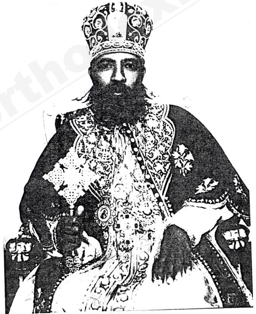
ብፁዕ ወቅዱስ አቡነ ጳውሎስ ፓትርያርክ ርዕሰ ሊቀ ልሳናት ዘኢትዮጵያ