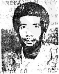
ከረጅም ፎቅ ወደቀው ላይ ደርሰው የተገኘው ለምሳሌ ደም