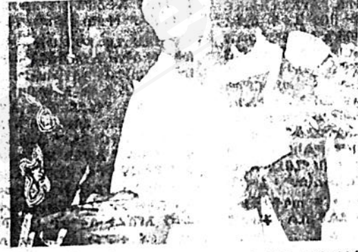
ቅዱስነታቸው ለሕዝብ ክርስቲያን በራሳቸው ለያስተላለፉ

ባሁኑ ጊዜ በሀገራችን በኢትዮጵያ ብዙ አዳዲስ ሁኔታዎችን ሲፈጠሩ እንደሚታዩ ሁሉ ቤ ከር