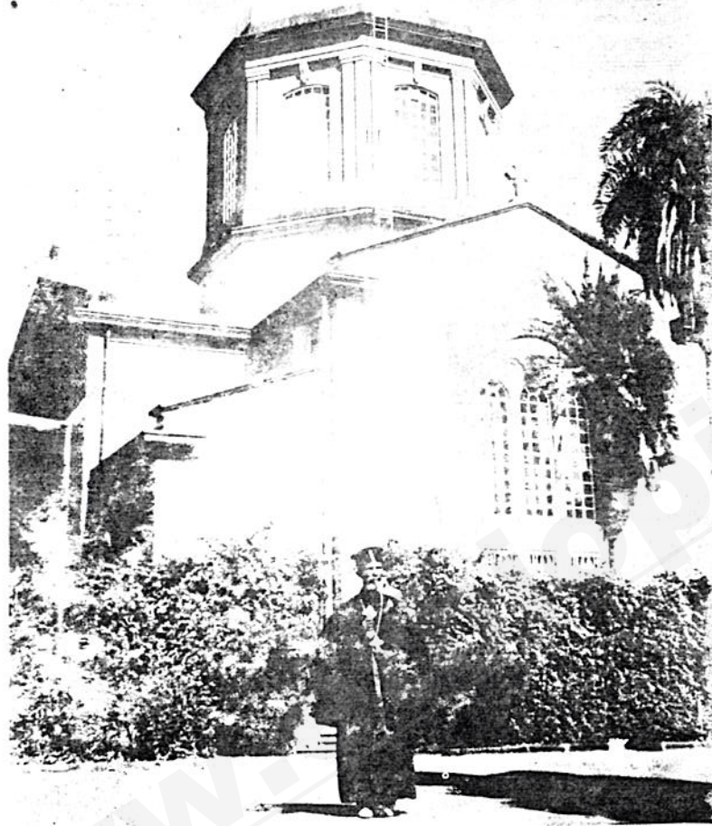
በአዲስ አበባ ፣ የምስካየ ገብናን መድኃኔ ዓለም ቤተ ክርስቲያን