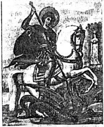
ሰማዕት ቅዱስ ጊዮርጊስ

በዘመነ ሰማዕታት ወንጌልን ሲያስተምሩ ስለ ክርስቶስ ሲመሰክሩ በመገናኛቸውም እንደገናይዮት ልጥያናስና እንደገና መከሰምያናስ ባሉ አለውያን ነገሥታት አንገታቸውን ለስለት ፣ ሥጋቸውን ለእሳት እየሰጡ በሰማዕትነት ያረፉ ቅዱሳን ብዙዎች ናቸው ከነዚህም አንደኛው ብዙውን መከራ የተቀ