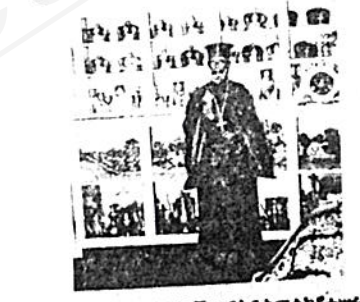
የግብተኛ ተከላላ የሚደረገው በአዲስ መልኩ ለሁለት

ይኛ/ የት.ቤቱን ሁለተኛ ደረጃ ለማስጀመር ተብሎ ከጀርመን ርዳታ ደርጅት በተገኘው ገንዘብ ከኮንትራክተሩ ጋር በተፈረመው ውል መሠረት ባለሁለት ፎቅ ሥራ ለሁለት ዓመት እንደሚፈጅ ተገምቶ የነበረውን በጅግ ርዳታ ጊዜ ውስጥ በሚያስደንቅ ሁኔታ ከታሰበው በላይ የጌ ፎቅ ሥራ በመጠናቀቅ ላይ ይገኛል።