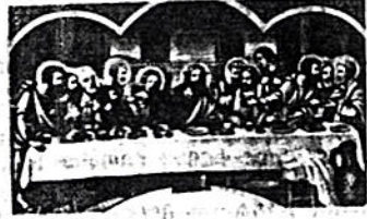
ጌታን ሊዮሱስ ክርስቶስ ለጾታ ማቆራረጥ የራት ገብጥ ሊያደርግላቸው