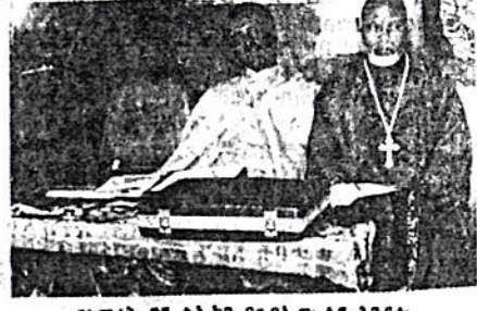
የስምራት ፪ኛ ልኩካን በጉባኤው ላይ እንዳሉ