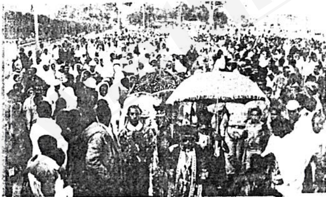
ለብሰ ተክህና የለበሱ ከህናት ቅዱስነታቸውን በክብር ሊተሰሱ

ብጹዕ ወቅዱስ አቡነ ጳውሎስ ፓትርያርክ ርእሰ ሊቃነ ጳጳሳት ዘኢትዮጵያ ጸሎተ ቡራኪአል