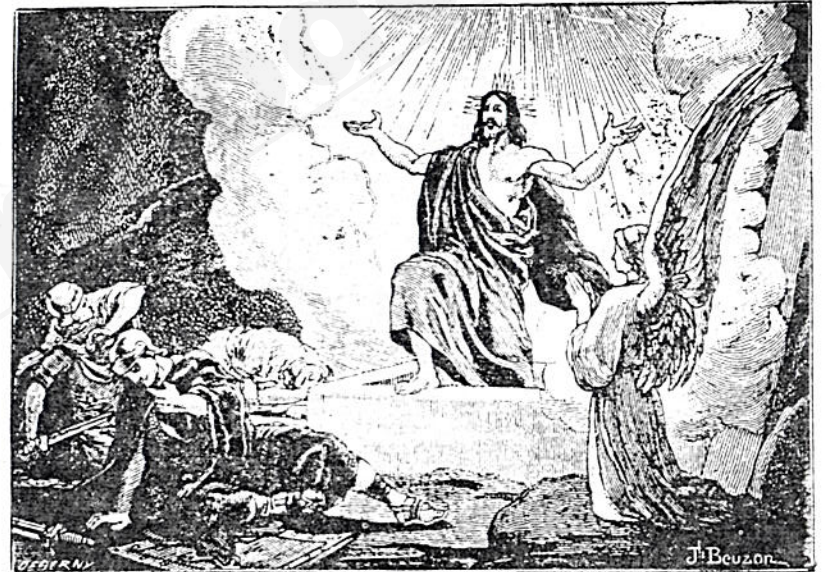
መድኃኔ ታላቅን ኢየሱስ ክርስቶስ በታላቅ ኃይልና ሥልጣን ከሙታን ተለዩቶ ተነሣ