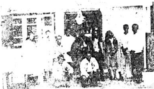
የገዳሙ ከካ ቤት ሠራተኞች ከገዳሙ የበላይ አስተዳዳሪ ጋር

ይኛ/ በመድኃኔ ዓለም መገንባት ታቦተ በግራው ላይ ካሁን በፊት የባርነን ችግር ስለነበረ በመስቀል ቅርጽ ተሠርቶ በዘመናዊ ፍላጎት ተገቢ አገልግሎት በሰጠው ላይ ይገኛል።