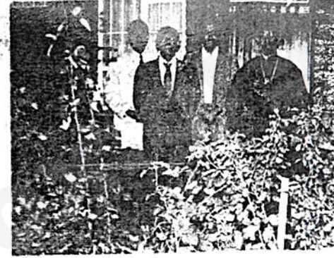
ከገዳሙ የልማት ኮሚቴ አባላት በካላ

ይኛ/ የግብር ማድቀቂያ ቦታ ከቤተ ልሔሙ ራቅ ያለ ስለነበር ለሥራ ችግር ፈጥሮ ነበር አሁን ግን ከቤተ ልሔሙ አጠገብ ተሠርቶ የግብር መስጫው ባለአንድ ተሸካሚ ከብ ቅርጽ ያለው ጠረጴዛ ሆኖ ተሠርቷል።