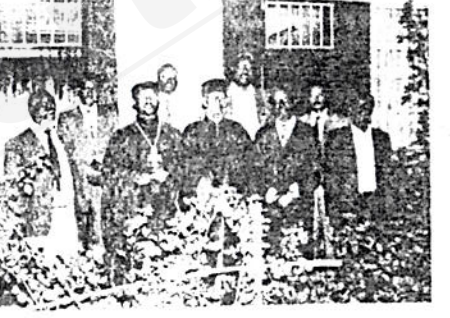
የትምህርት ቤቱ የትምህርት አመራር ኮሚቴ አባላት

ይኛ/ ሥርዓተ ተከላላ በሚደርስበት ጊዜ በአካላ ለላ ለጥረት ሥርዓት የተገነባረገ አድርጎታል። በግለሰብ አገልግሎት በተፈጸመላቸው ምእመናን በጋዜጣ ጭምር አስተያየት በመቅረቡ ችግሩም እየጎላ በመምጣቱ ይህን ለግታላል ፩ ጥንድ ስምንት አካላል ከ፲፬ ካባ ጋር ተሠርቶ ችግሩ እንዲቃላል ተደርጎአል።