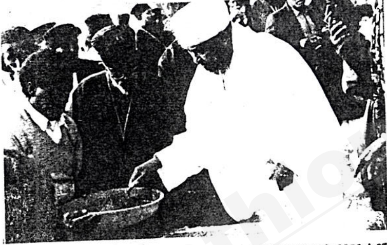
ብጹዕ ወቅዳሴ አቡነ ጳውሎስ ፓትርያርክ ዘሊትዮአድ በምስካየ ገዳማት የተገኘው የመሠረት ድንጋይ ሲያፋ

ስለዚህም ምስካየ ገዳማት ያዘኑ ገዳማት ከዙ፣ የተወሰኑት ፣ የተቸገሩ ሁሉ መግለጫ መጠ ጊያ መሸግ ማለት ነው ። በመሆኑም ይህ ታቦት በዚህ ስም እንዲጠራ የተፈለገበት ምክንያት አለው።