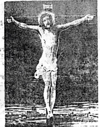
ግጥረ ሰው ስሙስተሉ ጳውሎስ ሰላም አደረገ ረው ጌታ ያስተማረውን ሁሉ በሥራ ሲገልጽው ማየት እጅግ ደንቅ ነው።

አሁን እንዳንበብንው፣ ጸ ጠላቶቻችሁን ወደዱ፣ በሚበድሩአችሁ ጸልዩ ሲል ያስተማ