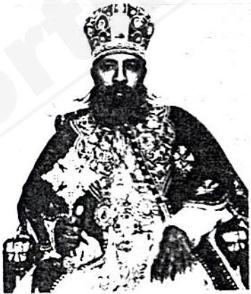
ብጹዕ ወቅዱስ አቡነ ጳውሎስ ፓትርያርክ ርእሰ ሊቃነ ጳጳሳት ዘኢትዮጵያ ቃል ምእዳን ለሰተላለፉ

— ከእግዚአብሔር የተሰጠውን የልጅነት ጸጋ እንድ ንቀበል የጽድቅን መንገድ እንድንከተል የዘላለም ሕይወትና የክብር ወራሾችም እንድንሆን የእግዚአ