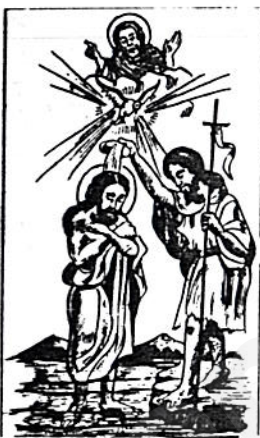
ጌታችን ኢየሱስ ክርስቶስ በእድ የሐንስ ሲጠመቅ

ጥምቀት ለሎቹን ምሥጢራት ለመሳተፍ የቤተ ክርስቲያን አባል ለመሆን የመጀመሪያው መግቢያ ጭር ነው ።