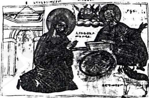
ጌታችን ኢየሱስ ክርስቶስ በቤተ ልሔም እንደተወለደ

“ክብር ለእግዚአብሔር በሰማያት ይሁን በምድርም ሰላም ለሰው ልጆችም በጎ ፈቃድ” ይህ የሰላም ዐዋጅ መድኃኒት ዓለም ክርስቶስ በተወለደበት ዕለት የተነገረ ነው ። በሰዎች አንድነት ሳይሆን በሰማይ የሚላኩት ሠራዊት የተነገረ የሰላም ዐዋጅ ነው ። ከሌሎች መካከል ሰላም አልነበረምና ስለ ሰላም ሊኖር የሚችል ግንኙ ሰው አልተገኘም ።