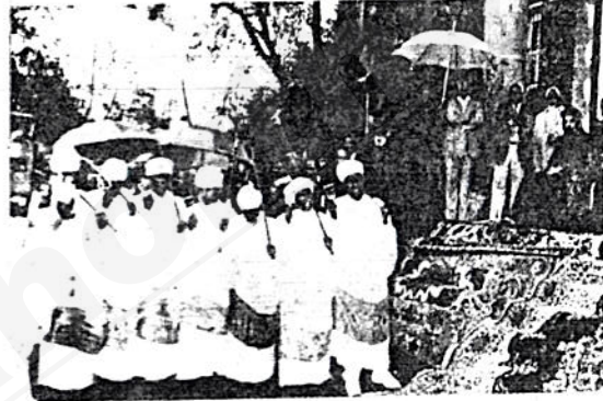
ጌታችን የጥምቀት በንል አካባቢ የከህናቱ ገጣጊ

ጌታችን አምላካችን መድኃኒታችን ኢየሱስ ክርስቶስ በተወለደ በ፴ ዓመቱ በየርዳናስ ወንዝ በየሐንስ እጅ ተጠምቆ ጥምቀትን መሠረተ ።