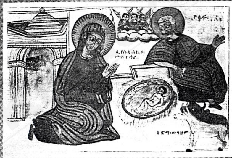
የጌታችን ኢየሱስ ክርስቶስ ልደት