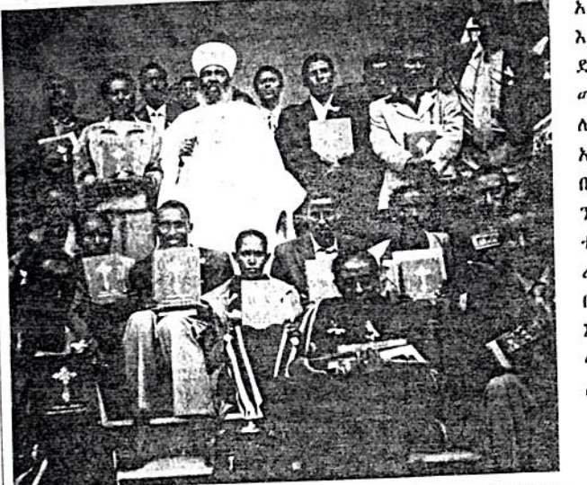
ጀግናዎ ሻለቃ ደራርቱ ተላ ደግሞ፤

እሷም ቀበል አድርጋ እንኳን አብር ደስ አለን አለችን። አያይገርም አንቺ አሁን በማሸነፍሽ ምን