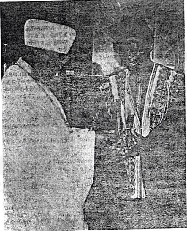
ዘውድ ጠቅላይ ሕዝብ ዳውሎስ ምክርቤት ኮሚሽን ሠራተኛ ሰዎች የስደተኞች ኮሚሽን ሠራተኛዎች (UNHCR) ለግዕዝ ጻፈው ሰዎች ስደተኞችን በመርዳት በሚገባ እንደ ላመሰግን እወዳለሁ። በዚህ ሂደት ብዙዎቹ የሌሎችን ሕይወት ለመቃደግ ሰላም ውድ ሕይወታቸውን አላልፈው መስጠታቸው ሊታወስ ይገባል።

በዚህ አጋጣሚ የተባበሩት መንግሥታት የስደተኞች ኮሚሽን መሪዎች ሠራተኞች ለምሳ ዓመት